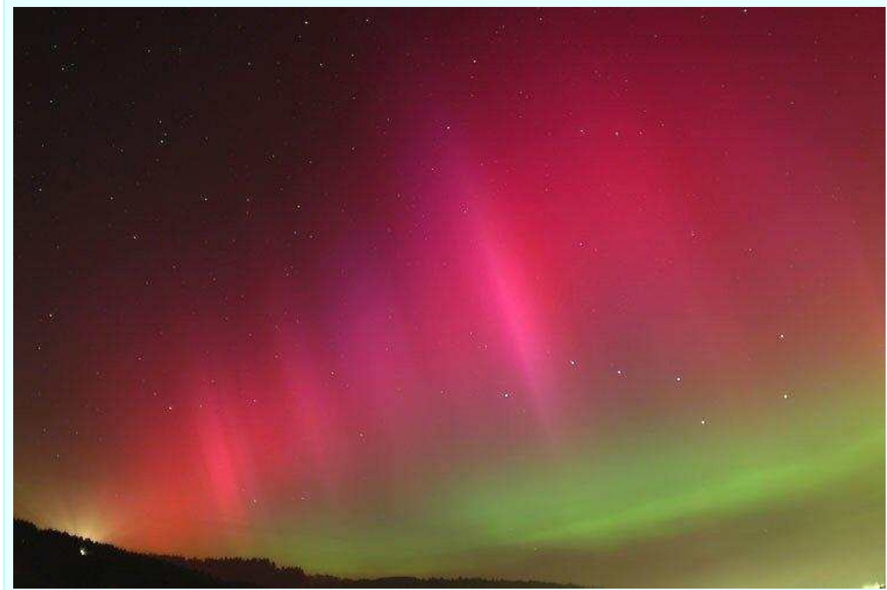
Рис. 2. Полярные сияния в октябре 2003 г.

эффекта заключается в том, что еще до регистрации на Земле крупномасштабного межпланетного возмущения, являющегося причиной магнитной бури, высокоширотные нейтронные мониторы регистрируют мерцания небесной сферы в космических лучах - эффект «гало» или свечение источника возмущения в «свете» космических лучей.