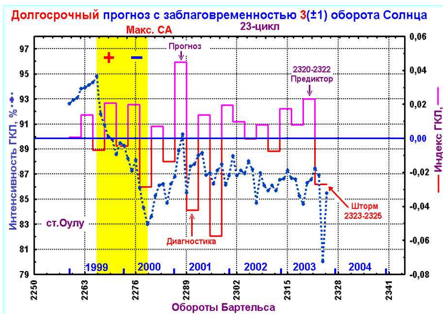
Рис. 3. Регистрация предвестника геоэффективного периода солнечной активности с августа на сентябрь 2003 г. (солнечные обороты № 2321-2322) с долгосрочным прогнозом на октябрь - ноябрь 2003 г. (№ 2323-2324). СА - солнечная активность; ГКЛ - галактические космические лучи.

Невероятным, с точки зрения существующих в научном сообществе в настоящее время представлений, является вывод о возможности долгосрочного прогноза с заблаговременностью \Delta T=3\pm 1 оборота Солнца вокруг своей оси (один оборот длится 27 дней). Тем не менее, еще в августе - сентябре текущего года (обороты № 2321-2322) нами был зарегистрирован (и выставлен в Интернет - http://ikfia.ysn.ru/fluctuations/ ) предвестник с долгосрочным прогнозом на октябрь - ноябрь 2003 г. (обороты № 2323-2324).